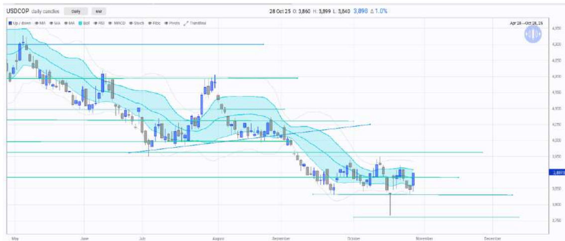
Figura 3: Gráfico del USDCOP con bandas de Bollinger – último año.

Las correcciones del 5 y el 9 de septiembre llevaron a un fortalecimiento de las monedas emergentes. En Colombia el fortalecimiento fue mayor que en la región. Desde entonces, el mercado se ha anticipado a un cambio de ciclo macroeconómico hacia un dólar debilitado, materias primas costosas y tasas de interés bajas en EEUU.