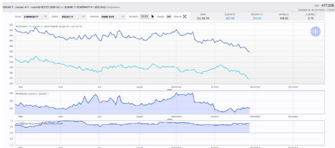
Figura 2: Gráfico del primer contrato de Azúcar #5 (Londres, azul oscuro), #11 (Nueva York, azul claro), la prima blanca en USD/mt y la correlación de sus retornos diarios móvil a 20 días de mercado.